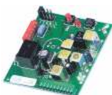
70182 Inplugbare ontvanger 40 MHz, 1 kanaal voor sturingskast