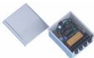
70231 Ontvanger in behuizing 40 MHz, 1 kanaal, geheugen 200 codes