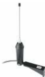
70187 Versterkingsantenne 433 MHz, 4 m kabel