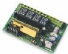
AU02810 Ontvanger 433 MHz, 4 kanalen voor behuizing AU02800 en AU02600, knipperlicht 70710 en 70724, 12-24 Vac-dc