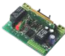
AU02910 Inplugbare ontvanger 433 MHz, 2 kanalen voor sturingskast