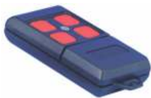
70201 Zender Dip Switch 433 MHz, 4 kanalen