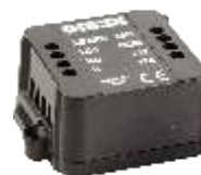
AU02540 Universele ontvanger 433 MHz, 1 kanaal Afm. 42 x 48 x 25 mm

Opgelet: enkel te gebruiken voor vervanging of uitbreiding van een bestaande installatie