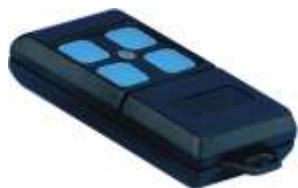
70185 Zender Dip Switch 40 MHz, 4 kanalen