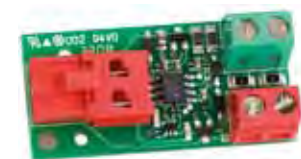
Interface BUS XIB (voor gebruik klassieke fotocel op sturing 24 V)