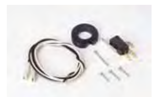
Kit eindeloop (open en dicht)*