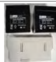
Noodbatterij (Type voor E124)