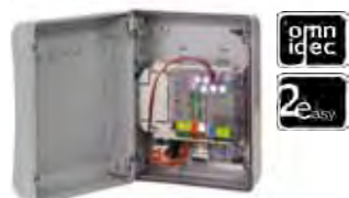
Motorsturing E024S Technische spec. zie pag. 196