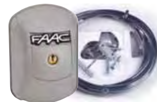
Ontgrendelingsmechanisme inclusief kabel en cilindslot XK21L 24V