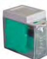
Noodbatterij XBAT 24 (Type voor E024S)