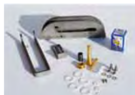
SDE 390, extern ontkoppelingssysteem zonder kabel, voor ontgrendeling van de hekvleugel