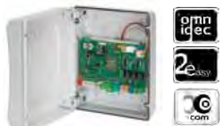
Motorsturing E124 Technische spec. zie pag. 196