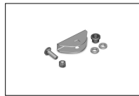
KT218 Sleepbeugel poort voor knikarm serie.