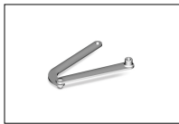
LT302 Korte armen voor knikarm motor.