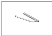
LT338 Hendels met slede arm voor knikarm.