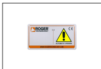
R99/C/001 Uithangbord "Automatic Opening".