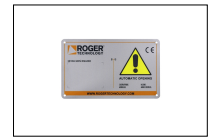
R99/C/001AL Uithangbord "Opent automatisch". Aluminium versie.