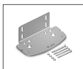
KT208 Bevestigingsplaat voor R23 series.