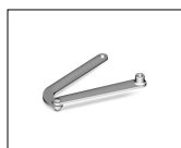
LT302 Korte armen voor knikarm motor.