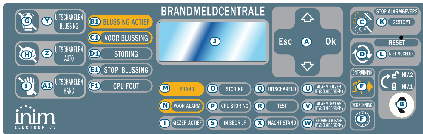
Afbeelding 1 - Frontpaneel van de centrale